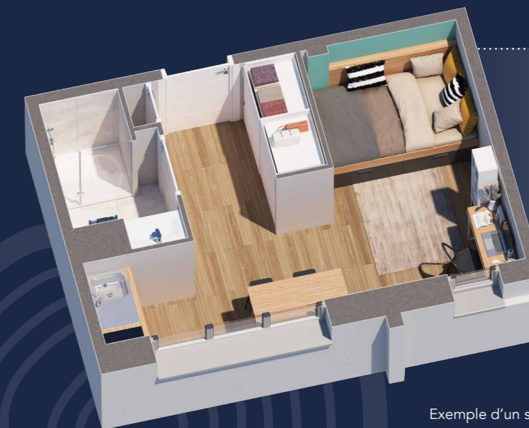
Exemple d'un studio de 18,95 m 2