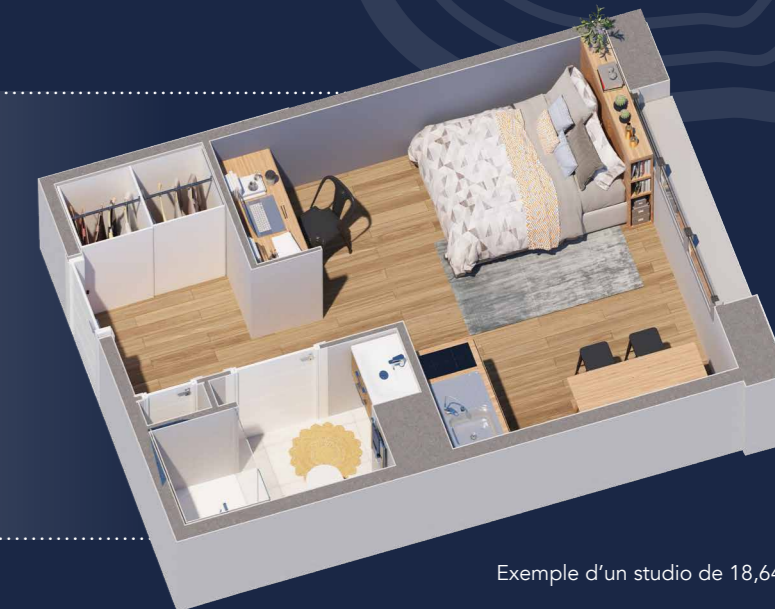
Exemple d'un studio de 18,64 m 2