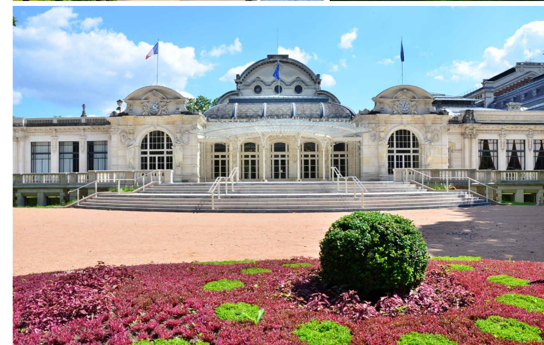
Le Palais des Congrès et l'Opéra de Vichy