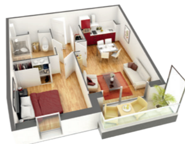
Exemple de disposition pour un appartement 2 pièces