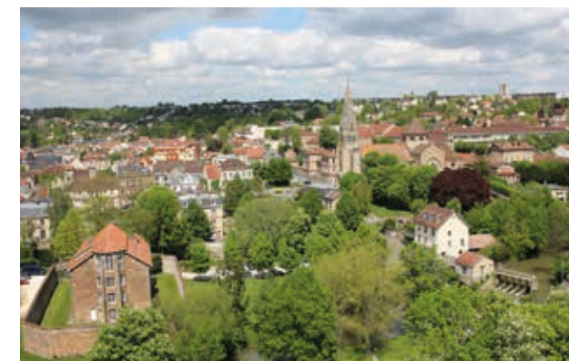
Une ville verdoyante à taille humaine à l'architecture préservée

À seulement 1h de la capitale, Coulommiers a su préserver son cadre de vie rural et charmant. Dans une région au patrimoine paysager et naturel, peuplée de villages de caractère à forte attractivité touristique, la qualité de vie promise aux habitants de Coulommiers allie harmonieusement la richesse de son terroir et la modernité de ses installations. Une situation privilégiée en Ile-de-France qui réunit art de vivre et dynamisme économique.