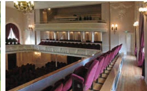
Le théâtre municipal de style art nouveau récemment restauré