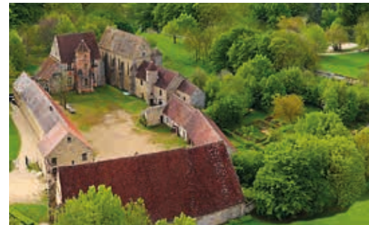
La Commanderie des Templiers édifée au XII e siècle