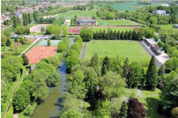
Le parc des Sports des Capucins, terrains de jeux des sportifs de tous âges

Un art de vivre unique en Ile-de-France qui réunit tous les atouts d'un territoire d'exception : quand histoire, nature et tradition participent au dynamisme de toute une région.