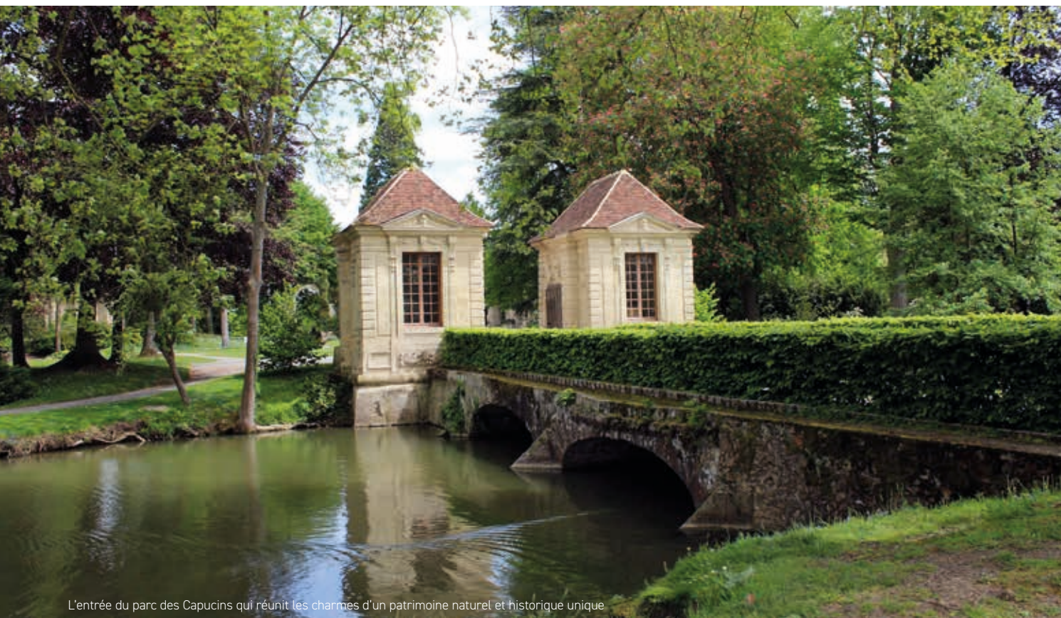
L'entrée du parc des Capucins qui réunit les charmes d'un patrimoine naturel et historique unique